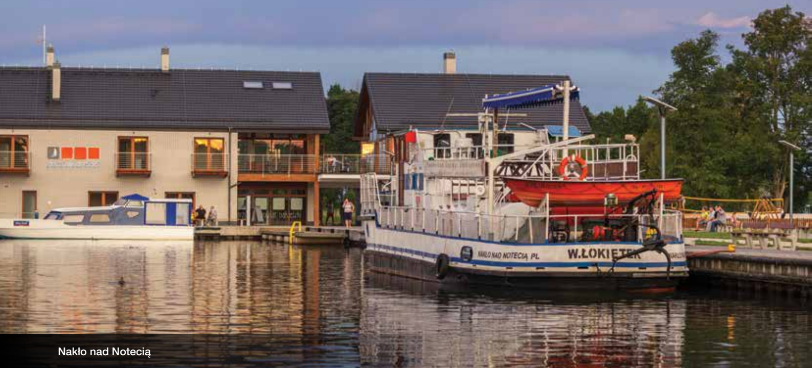
Nakło nad Notecią