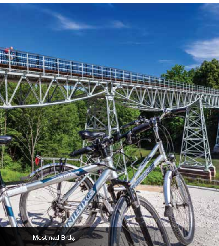
Most nad Brdą

Przejazd zaczynamy w parku nad Starym Kanałem Bydgoskim w okolicy ronda Grunwaldzkiego. Jedziemy wzdłuż brzegu, skręcamy w ul. Bronikowskiego w prawo. Po dotarciu do ul. Grunwaldzkiej odbijamy w lewo. Przejeżdżamy przez węzeł, tak żeby znaleźć się na drodze rowerowej po prawej stronie ul. Nad Torem. Jedziemy nią prosto na północ. Trasa początkowo asfaltowa po przecięciu skrzyżowania z ul. Opławiec przechodzi w szutrową. Tu zaczyna się najbardziej wymagający fragment szlaku. Na krótkim odcinku ścieżka faluje i wije się między drzewami. Do Trzyszczyna jedziemy równoległe do ruchliwej drogi krajowej nr 25 (DK25).