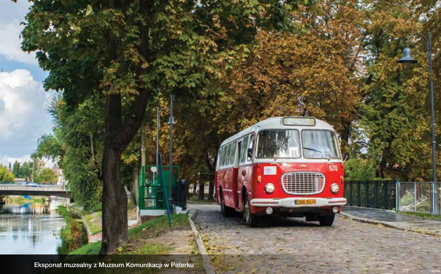
Ekspонат muzealny z Muzeum Komunikacji w Paterku

Olszewka od ponad 15 lat zaprasza na pole golfowe – jeden z punktów „Ekomuzeum”. Jeśli chcemy zacząć przygodę z golfem – dobrze trafiliśmy. To miejsce przyjazne zarówno dla profesjonalistów, jak i tych, którzy chcą poznać podstawy tej gry.