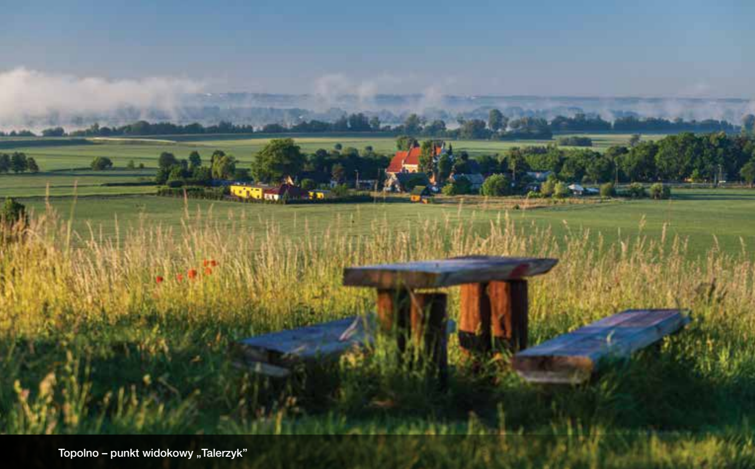
Topolno – punkt widokowy „Talerzyk”

Topolno nazywane jest „Częstochową Północy” za sprawą Sanktuarium Matki Bożej Uzdrowienia Chorych. Pierwszymi gospodarzami kościoła byli oo. Paulini, którzy otrzymali budynek w roku 1685, dwa lata po ukończeniu jego budowy, wraz z cudownym obrazem. Miejscowa legenda głosi, że wizerunek Maryi przyplłynął tu Wisłą. By zachwyć się panoramą królowej polskich rzek i otwartymi przestrzeniami utworzonego tu ćwierć wieku temu Nadwiślańskiego Parku Krajobrazowego warto wdrapać się na punkt widokowy „Talerzyk”, w miejscu średniowiecznego grodziska, po którym niestety nie pozostał już ślad. Nieopodal znajduje się „Winnica przy Talerzyku” – rodzinna manufaktura, w której od kilku lat dojrzewają soczyste grona i powstają wytrawne trunki. Z wiatrem we włosach i lampką wina w dłoni wysłuchamy opowieści o winiarskich wyzwaniach, zasobach starej piwniczki i spełnionych marzeniach. Sery od pobliskiego gospodarza dopełnią całości. To nie tylko degustacja wina – to smakowanie życia!