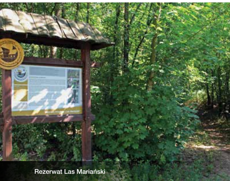
Rezerwat Las Mariański