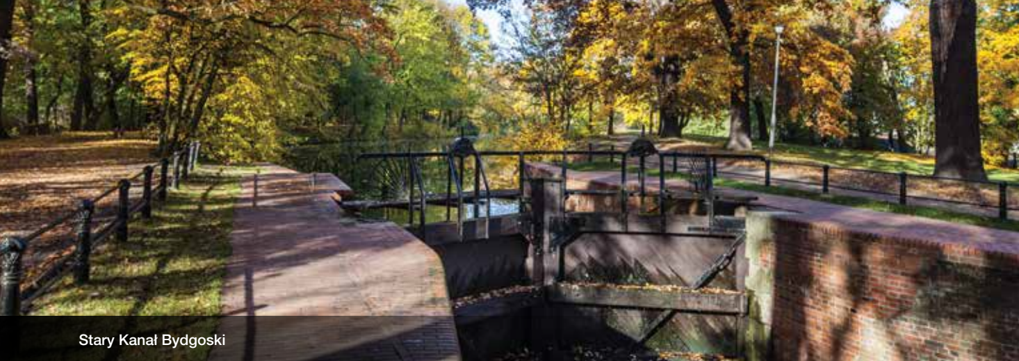
Stary Kanał Bydgoski