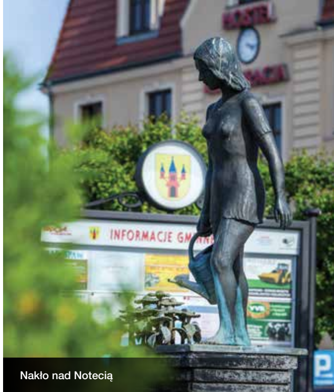
Nakło nad Notecią

Nakło nad Notecią to adres dobrze znany wodniakom. Przez miasto wiedzie Międzynarodowa Droga Wodna E 70. W jednej z najbardziej okazałych przystani śródlądowych w kraju możemy wypożyczyć sprzęt wodny. W basenie portowym kołyszą się jachty żaglowe, motorowe oraz inne jednostki. Udając się na spacer po Nakle dotrzemy do Muzeum Ziemi Krajeńskiej. Znajdziemy tu informacje na temat miasta i poznamy burzliwą historię Krajin. W zbiorach Muzeum znalazła się m.in. porcelana, fajans i szkło z polskich fabryk.